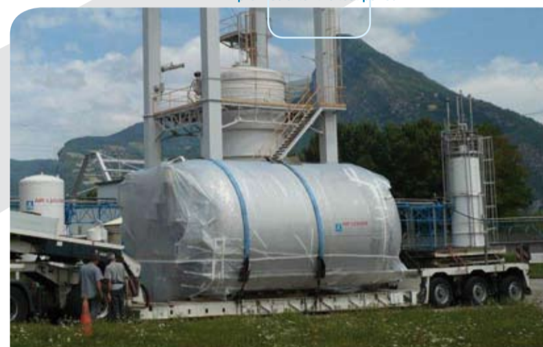
Le sous-système de génération d'oxygène au départ du site de Sassenage après la campagne de tests. The oxygen generation subsystem leaving Sassenage premise after the test period.

This cryogenic storage unit has numerous specific characteristics partly because of its long life-span (35 years, the same as the submarine) and partly because of the constraints of the sub-sea environment. A qualification campaign was set-up to test that each sub-assembly (cryogenic tanks, valves, sensors...) could sustain the vibrations, shocks, salty atmosphere, physical movements of the submarine and to test their electromagnetic compatibility. During the construction phase numerous technical operations were also set up (radio or ultra sound control of solder, advanced testing of the helium seals) on the components. Particular