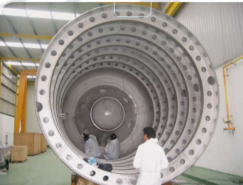
Le réservoir en cours de fabrication sur le site d'Aguilar y Salas, près de Barcelone. The tank being manufactured on the site of Aguilar y Salas, near Barcelona.

Cartagena before Christmas. During 2010 Navantia will integrate it in the hull section prepared for the purpose, before doing the same for the other two elements making up the AIP system: the fuel cell and the ethanol reformer. The three other cryogenic storage units will be delivered to Navantia in 2010, after being tested. The S-80 programme is set to deliver the four boats to the Spanish fleet between 2013 and 2015.