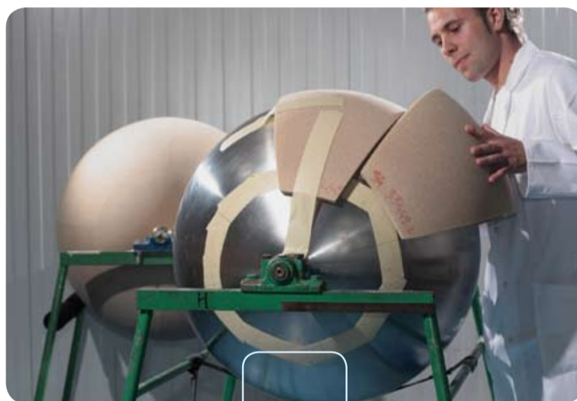
Une sphère de 157 L d'hélium à 240 bar. A sphere of 157 litres of helium at 240 bar.

La première « sphère hélium protégée » de 157 litres d'hélium à 240 bar devrait être livrée en 2010. En prévision ensuite, six sphères par an, jusqu'en 2015... au moins.