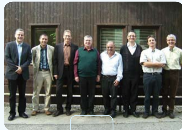
Les équipes du centre de recherche neutronique allemand et d'Air Liquide lors de la réunion de lancement du projet. The german research neutron source center and Air Liquide teams at the kick-off meeting.

*Expérience mise en oeuvre par le Centre de Recherche Neutronique Heinz Maier Leibnitz - FRM II