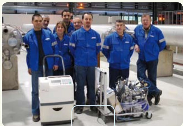
L'équipe du Consortium AL 40-30. The AL 40-30 consortium team.

AL40-30 est basée à Saint-Genis-Pouilly (01), à proximité du CERN. Depuis 2003, l'équipe réalise des travaux de montage, d'étuvage, de contrôle d'étanchéité et de maintenance des installations