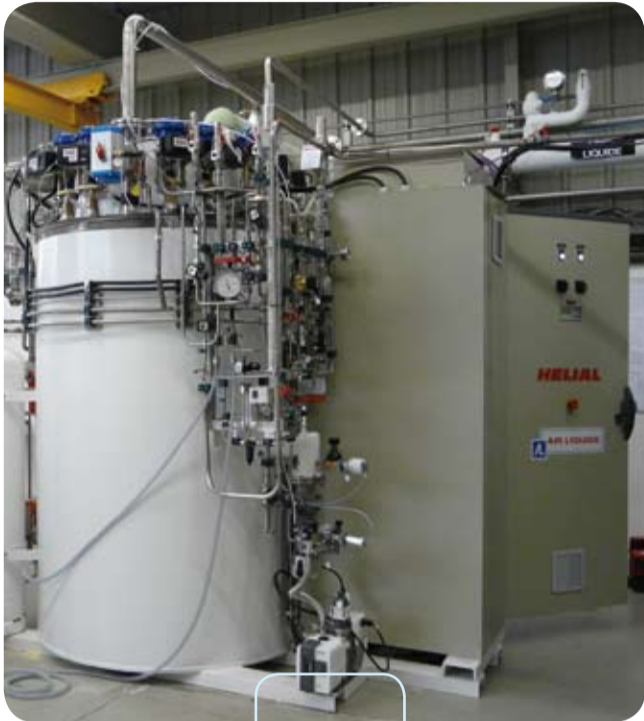
L'HELIAL SL de l'Université de Chalmers en Suède a subi des tests sur le site d'Air Liquide DTA à Sassenage. The HELIAL SL for the Chalmers University in Sweden has undergone tests at the Air Liquide DTA site in Sassenage.

Les liquéfacteurs HELIAL sont des appareils standard intéressants surtout les laboratoires de recherche qui ont besoin de refroidir des composants à 4,5 K, soit une température proche du zéro absolu (-273,15 °C). Selon la capacité de liquéfaction recherchée, la gamme se décline en trois modèles : SL, ML et LL (1) . Grâce à un HELIAL SL en service depuis juin 2009, le Département de micro-technologie et de nanoscience de l'Université de Chalmers (Göteborg, Suède) est en mesure de produire jusqu'à 900 litres d'hélium liquide par semaine. À Cambridge, les activités du Cavendish Laboratory nécessitant des besoins plus importants en hélium, l'équipement installé en